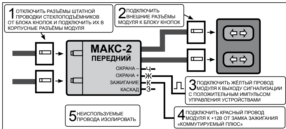
Рисунок 3. Схема подключения модуля МАКС к сигнализации с положительным импульсом на выходе управления внешними устройствами