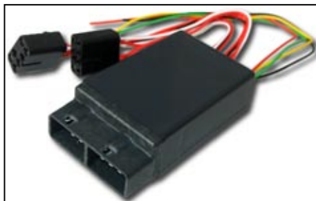
Рисунок 1. Модуль МАКС-2

5.5 Другие автомобили. Для установки модуля на другие автомобили рекомендуется использовать разъемы кнопок от автомобиля LADA 110. Схема электрических соединений приведена на обложке Руководства.